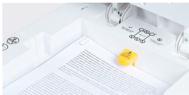
Détruit aussi les documents avec agrafes et trombones.