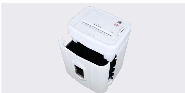
Réceptacle de 20-litres extensible.